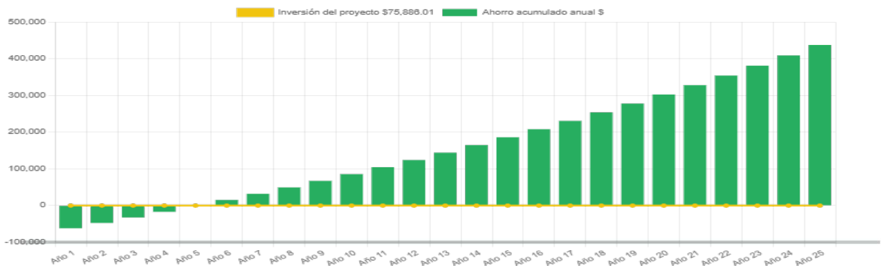
Ahorro económico acumulado a 25 años