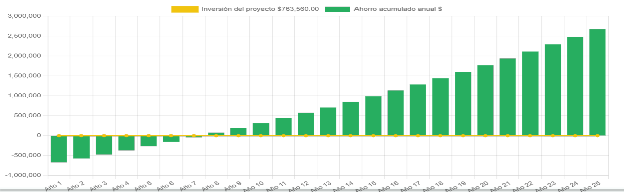
Ahorro económico acumulado a 25 años