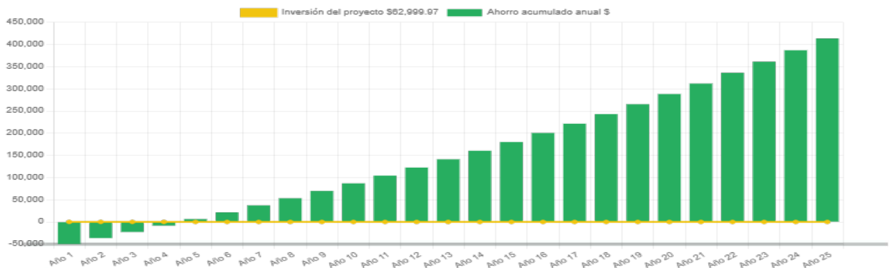
Ahorro económico acumulado a 25 años