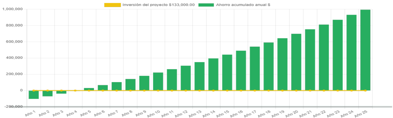
Ahorro económico acumulado a 25 años